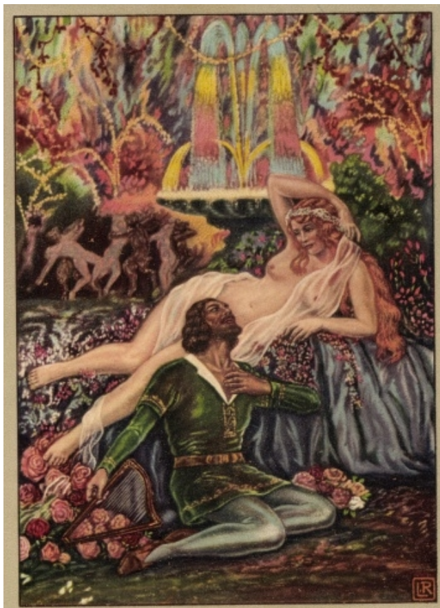
figuur 68 – Tannhäuser bij Venus

In de tekst en de muziek voelen we overal Tannhäusers onstuimige enthousiasme voor deze nieuwe belevingswereld. Maar hij ziet ook het enorme belang in van deze ontdekking. Hij beseft – en wijst Wolfram daar ook op – dat diens levenshouding de wereld juist zal verzielen . Als de mens zijn liefdeskracht en creativiteit niet activeert, verziekt de menselijke wereld. Vervolgens pareert hij Wolfram met de woorden: “God, de hemel en de sterren, die zijn onbereikbaar, die kan je enkel prijzen en aanbidden. Maar wat zich in je eigen wezen bevindt en juist om beroering vraagt, dat kun je onverschrokken naderen. En je vindt een onuitputtelijke bron, die je alles, wat de liefde dient, kan brengen.”