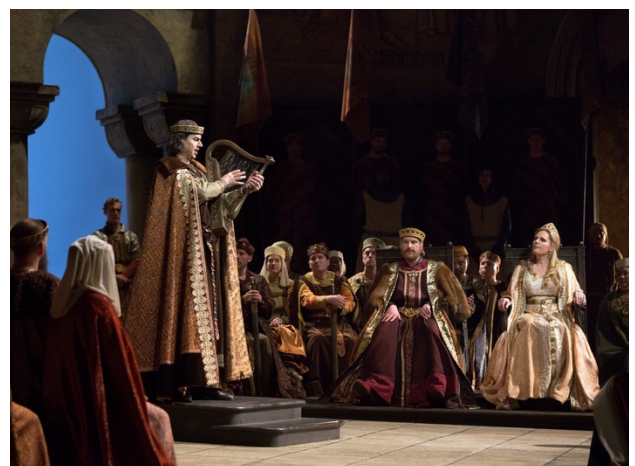
figuur 69 – Tannhäuser – Metropolitan Opera New York, 2004 (rechts: Wolfram, Landgraaf, Elisabeth)