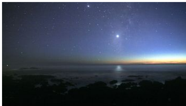
figuur 64 – Venus als Avondster