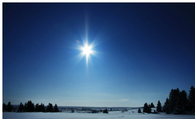
figuur 65 – Venus als Morgenster

Dan is ze tot de Morgenster geworden, die ons vlak voordat het daglicht weer aanbreekt en we die nieuwe werkzame levensdag ingaan, met nieuwe liefdevolle idealen heeft vervuld. Dan is ze te vergelijken met de moeder, van waaruit het nieuwe leven wordt geboren.