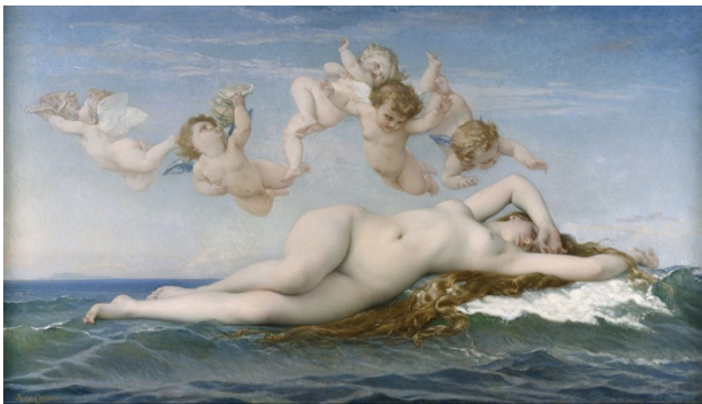
figuur 63 – De geboorte van Aphrodite (Venus)

Het onderbewuste wordt altijd door het element water gesymboliseerd, het dagbewustzijn door het element aarde. Venus – bij de Grieken Aphrodite – wordt uit het schuim der branding geboren, zo vertelt de Griekse mythologie. Levenskrachten zoals liefde, moed, geweten, trouw of onderscheidingsvermogen worden altijd pas door de nood gedwongen wakker geroepen. Ook het mythische beeld van de geboorte van Venus roept dit inzicht op. Ze komt immers uit ‘onrust’ in het onderbewuste, uit de branding van de zee boven.