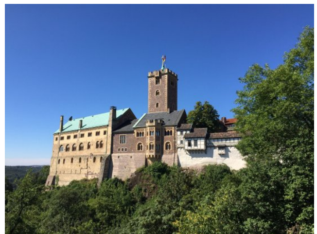
figuur 66 – De Wartburg te Eisenach (Duitsland)

Wolfram beziet die innerlijke liefdesbron als iets goddelijks, wat je op geen enkele manier mag bezoedelen met je menselijke verlangens, laat staan drijven. (Te vergelijken met de drieboek van zuiver goud met het tetragrammaton .)